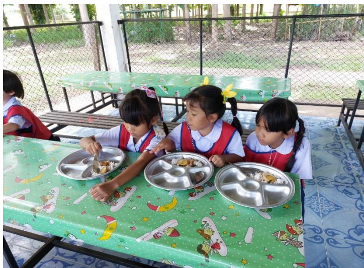
ภาพเด็กแย่งอาหารผู้อื่น