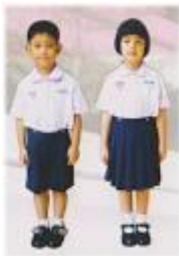
ภาพการแต่งกายของเด็กที่ไม่เรียบร้อย